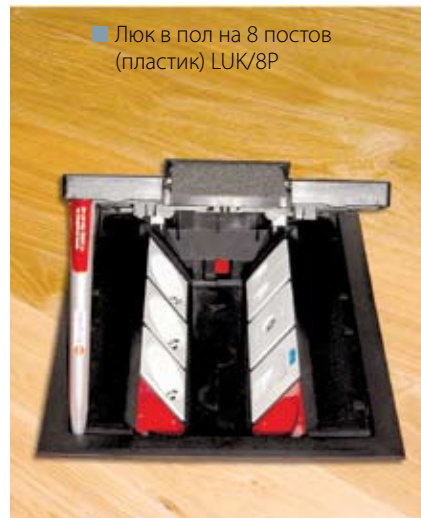
■ Люк в пол на 8 постов (пластик) LUK/8P