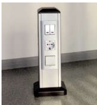
TR-16M/2 Колонна двухсторонняя

Системы люков и колонн – профессиональное решение для организации рабочих мест в открытых интерьерах, так называемых "open space". Это многоцелевая система для офисов, разделенных лишь мобильными перегородками, прикассовых зон торговых центров и магазинов, выставочных центров, аэропортов, автосервисов, хранилищ, музеев и спортивных площадок, банков, школ и других помещений административного назначения – везде, где требуется прямое подведение электропитания и информационных сетей на площади в удалении от основных стен.