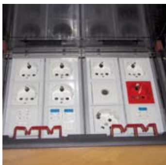
LUK/12, люк в пол на 12 постов Сталь