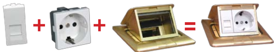
Механизм компьютерной розетки