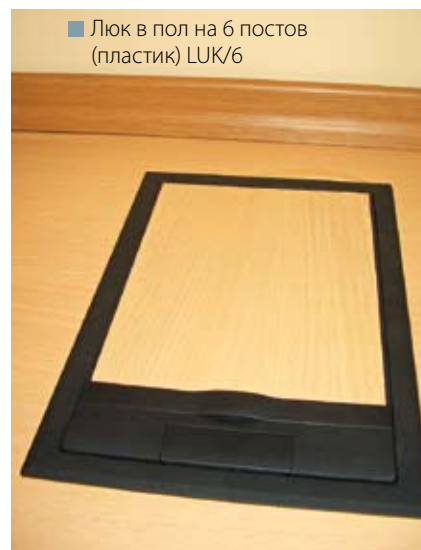
■ Люк в пол на 6 постов (пластик) LUK/6