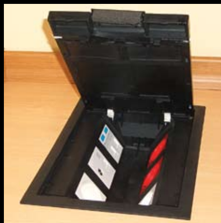
LUK/6 Люк в пол на 6 постов 45x45 мм, пластиковый.