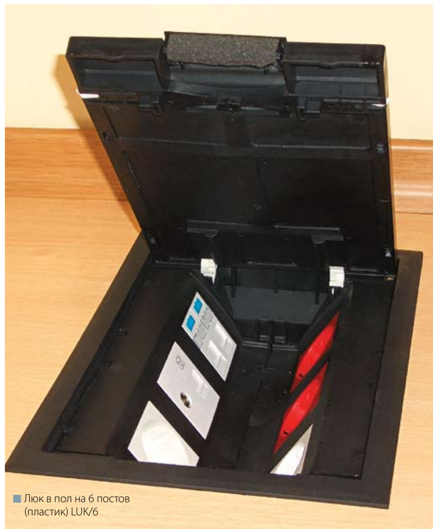
■ Люк в пол на 6 постов (пластик) LUK/6